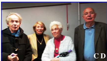
Les gagnants du tournoi Beaujolais