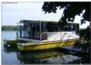
Une navette à propulsion hydro-électrique et solaire

A midi : restaurant "la Nouvelle Passerelle" à Décines